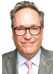
RENÉ VILLEMURE DÉPUTÉ FÉDÉRAL DE TROIS-RIVIÈRES

Depuis 1967, la ville de Trois-Rivières vit au rythme du spectacle des meilleurs pilotes qui rivalisent de talent et qui compétitionnent afin de gravir la marche supérieure du podium. Chaque année avec le GP3R, et pour quelques jours, c'est un peu de Monaco qui s'installe dans les rues du « circuit en ville » alors que les compétitions de F-1600 succèdent à celles du Nascar et du Super Production Challenge. C'est, chaque fois, tout un spectacle.