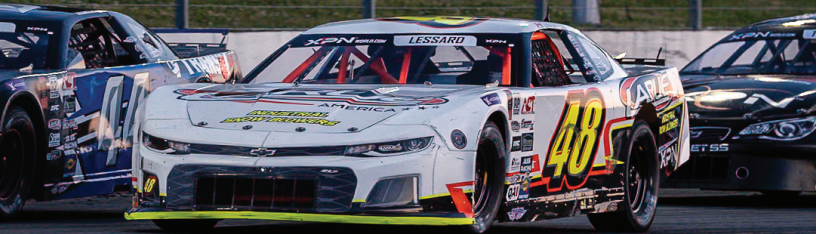
RAPHAËL LESSARD PILOTE NASCAR AMBASSADEUR XPN