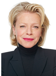
CAROLINE PROULX MINISTRE DU TOURISME ET MINISTRE RESPONSABLE DE LA RÉGION DE LANAUDIÈRE